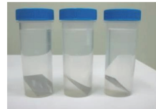
図1 溶出試験に用いた容器と試験片