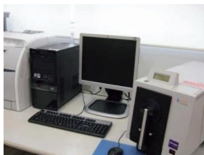
図2. 分光光度計（測色機）

(長谷川 他, J. Jpn. Soc. Colour Mater. , Vol. 90, No. 1, pp. 11 (2017) の Fig. 5 引用)